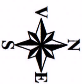
PLAN DE SITUATIE Scara 1:1000